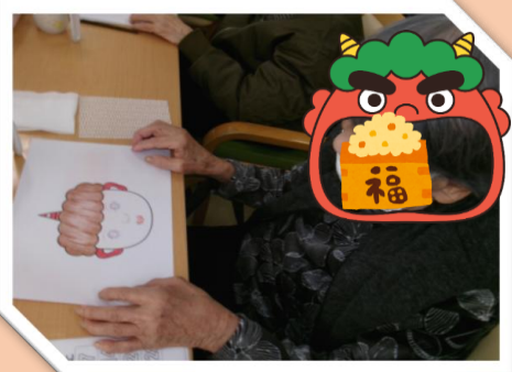
今月も沢山アクティビティをしました