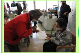
ぬり絵を頑張っている皆様を表彰しました。これからも意欲的に取り組んでくださいね。