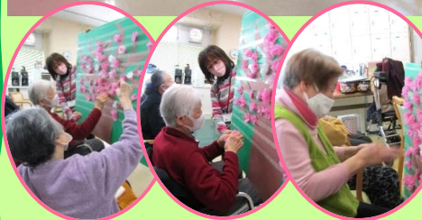
楽器をいろいろ使って合奏を楽しんでいます。「さくらさくら」では桜の花をボードに貼り付けて満開の桜の木を完成させました。