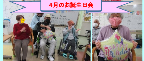
毎月第4週目にお誕生日会をしています。施設からささやかなプレゼントもどうぞ♡