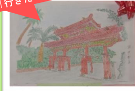
ぬり絵コンクール