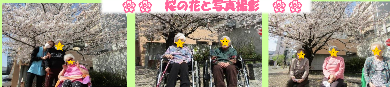
ご近所へお出かけしてハイ、ポーズ。やっぱり外は気持ちいい、笑顔と桜が満開でした。